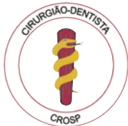
Conselho Regional de Odontologia de São Paulo