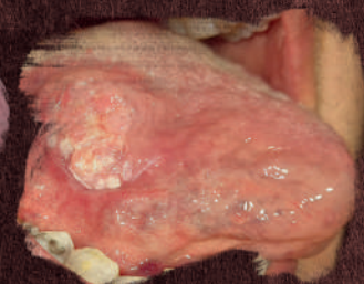
Úlcera em borda de língua.