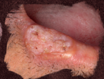
Úlcera em vermelhão de lábio inferior.