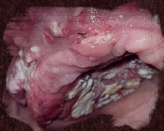
Úlcera extensa em palato e rebordo.

O Cirurgião-Dentista também pode fazer o diagnóstico, por meio de uma biópsia. Mas existe uma maneira eficaz de detecção de anormalidades: o autoexame da boca, uma técnica simples que a própria pessoa pode aplicar e, assim, identificar mais facilmente estas anormalidades.